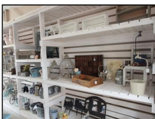
↑ピースフルガーデン店内