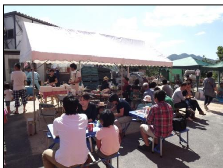
↑とっても盛り上がりました！

たのは“楽しかった！”次に“ピザがおいしかった！”そして、いろいろリクエストもいただき、意外に多かつたのが“こういうイベントを年に2回やってほしい”というものでした。というわけで、来年は春と秋の2回開催したいと思います。そして、より笑顔溢れる感謝祭にしていけたらと思っています！