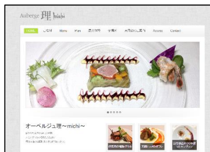
↑オーベルジュ理さんのHPです