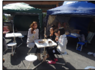
晴れていたのですが風が・・・

今回の感謝祭では、定番の焼きそばや焼き鳥、フランク綿菓子、好評のピザはもちろんと思っていたのですが