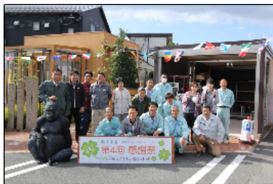
どうもありがとうございました！

今回は秋らしく、『焼き芋』に変更いたしました。寒かった事もあり、焼き芋は大好評でした。今回は、お子様ともっと楽しんで頂けるように、定番の輪投げはもちろん射的やストライクナイン、スーパーボーすくい、あとは人気の重機に乗って写真撮影ができるようにもさせていただき、とても楽しんでいただくことができました。そして、初めての試みで、弊社のお客様にシフォンケーキを販売していただきました。せっかくなので、多くの人にお集まりいただきますので、何か新しい事ができないかなと思ひ、事前にお声がけさせていただき出店していただいたのです。こちらも好評でしたので、次回2016年5月の最終日曜日に開催予定の春の感謝祭で趣味の何かを