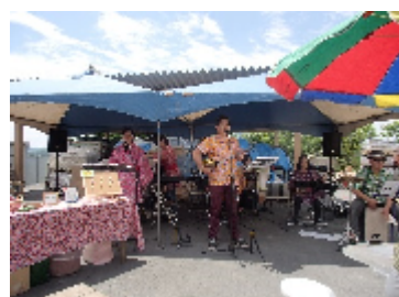
あしびな様のライブ

今回は遠く舞鶴・福知山・日高方面からも参加いただき150名を超える皆さまと楽 しく過ごさせて頂きました。懐かしいお客様のお顔も見ることができお仕事をさせて 頂いた時には、生まれたばかりだったお子様がこんなに大きくなりましたとお顔をみ せて頂き大変嬉しい思いをさせて頂きました。たくさんの方にペットボトルピザの申 し込みをいただきましたが、抽選に外れた皆様にお詫び申し上げます。今回は記念 写真も撮れず少し残念ですがお許し下さい。又、たくさんのお客様にお越しいたさ ながら、お一人お一人お話し出来なかったことが心残りですが、たくさんのお客様の 笑顔を見ることができまして本当に嬉しかったです。