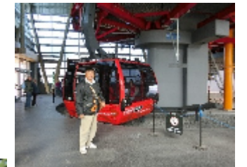
3kmの鉄塔間の大型ゴンドラ