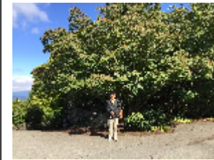
自然樹形のヤマポーシ