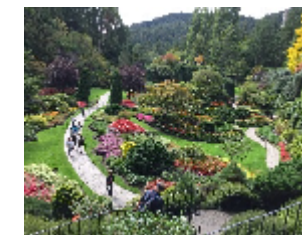
↑ブッチャートガーデンのメイン庭園↑