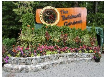
ブッチャートガーデン

9月初旬に、LIXIL様協賛の代理店の研修会がありバンクーバーに行ってきました。自然豊かで「ガーデン」の進んだカナダは一度行って見たかった所でした。もともと飛行機が苦手な私が10時間にも及ぶ飛行に耐えられるか心配でしたが、何とか無事に帰ってきました。バンクーバーは気候も良くて