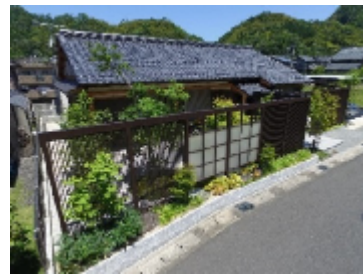
エクステリアコンテスト 2016 銀賞 舞鶴市K様邸

昨年の暮れにLIXIL様より嬉しいご報告をいただきました!! 全国最大級のエクステリアコンテストで銀賞(舞鶴市K様邸)。 又、全国の建築関連業者対象で行われますメンバーズ コンテスト2016の外装・エクステリア部門でディティール賞 (京丹後市T様邸)を戴きました。