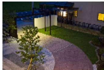
翌年(2013年)のメンバーズコンテスト 関西地域最優秀賞受賞 京丹後市H様