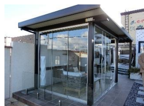
↑カーポートを使用したオールガラスポーチ

だん寒くなって行きますが、お身体に気をつけてお過ごしください。本年もご愛顧いただきありがとうございます。来年も宜しくお願いします。