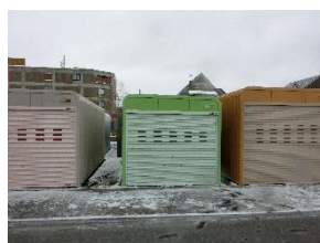
↑カスケードガレージ

札幌と石狩で頑張っておられる同業者の会社に研修に伺わせていただきました。コンクリートの寒さに対する構造や施工方法の違いに驚きました。弊社も雪国で積雪対応の商品展示に苦労していますが、北海道の業者様は私の頭の中で「絶対に積雪地では施工できない」と思っている商品でも加工を加えて見た目もきれいに独自の方法で施工されていて「目からうろこ」状態でした。私もこの経験を参考に新しい商品をお客様に提供し喜んで頂けるよう精進していきたいと思っております。今年も残り少なくなりました。年末に向かいだん